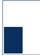
1/4 Seite 88 mm x 133 mm