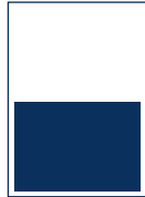
1/2 Seite 180 mm x 133 mm