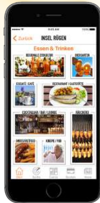
Rubrik „Essen & Trinken“