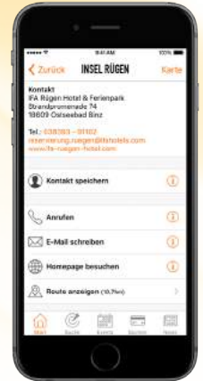
Seite mit Kontaktdaten